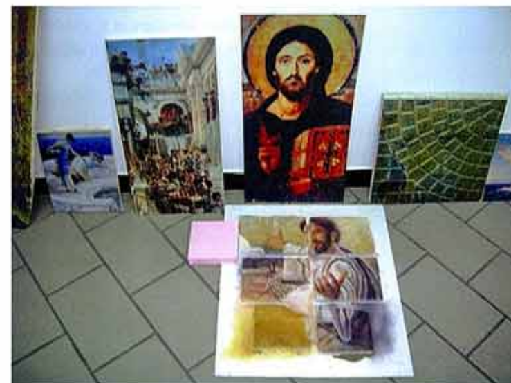
Un piccolo campionario di lavori imprevedibili